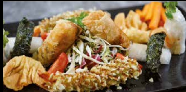
Viet Mix Tapas