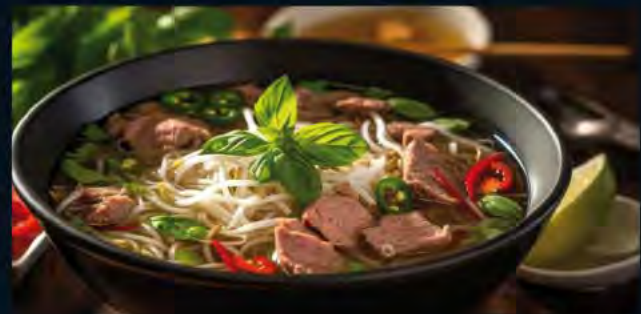
Pho bo tai