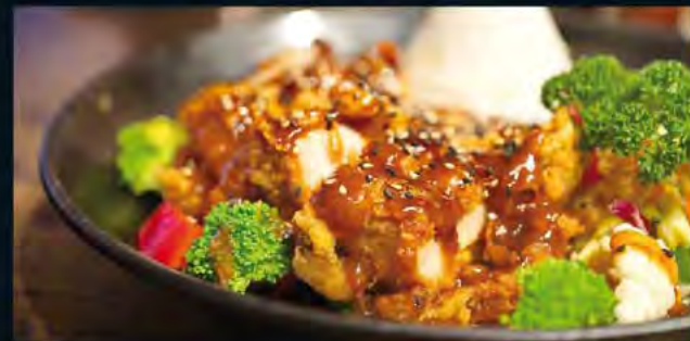
Xao mit Hähnchen